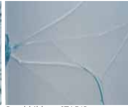
Bruchbild SGG STADIP